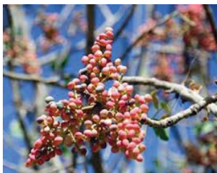
وَنه سوره /vana sure/؛ وَتَقِّی /vanataqqi/