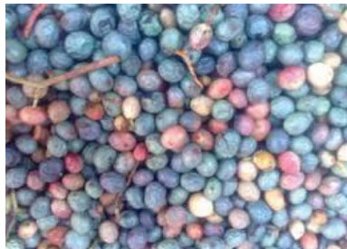
وَنه کوه /vana-kave/