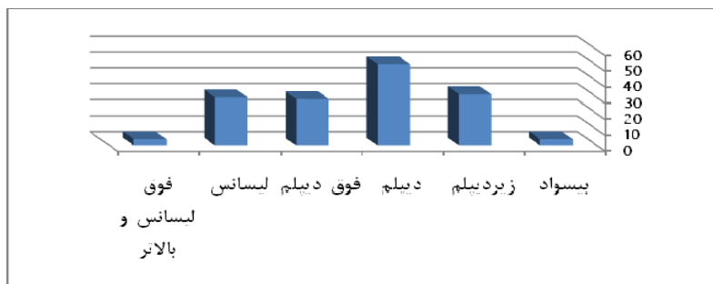
نمودار شماره ۴-۳: نمودار ستونی درصد فراوانی افراد ترک‌زبان براساس تحصیلات

۵۸٪ از کل نمونه مورد ارزیابی فاقد تحصیلات دانشگاهی هستند.