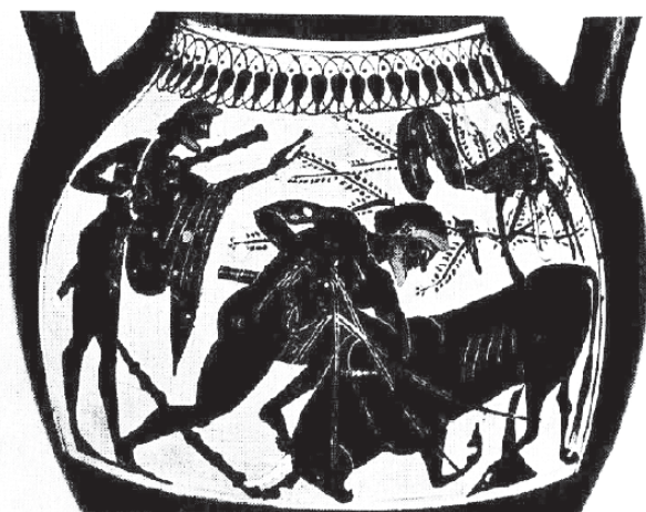
تصویر شماره ۴: نقاشی بر گلدانی یونانی (۵۳۰-۵۱۰ پیش از میلاد)، هرکول در حال کشتن گاو کرتی.

پشت او بز شاخ‌داری است که درختی همانند درخت زندگی از پشتش روییده است؛ درست مانند رویدن گیاه از پشت گاو در مَهری که در بالا شرح داده شد. نیز در تصویری که بعدها روی گلدانی (۵۳۰-۵۱۰ پیش از میلاد) از هرکول به همراه گاو کرتی نقش شده (تصویر شماره ۴) و از بدن گاو گیاه روییده است. تصاویری که به یک سنت مستمر اشاره دارد و نشان‌دهنده آن است که اصل حیات مجدد که پیش از این به ایزدبانوی دوجنسی تعلق داشته، بعد کاملاً در حیوان نر و ایزد نر جوان تجلی یافته است (Ibid: 135).